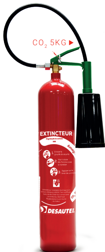
CO 2 5KG ▶