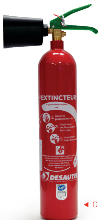
◀ CO 2 2KG